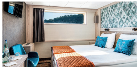
Standardkabine auf dem Hauptdeck