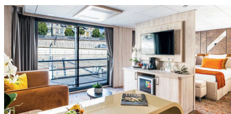
Mastersuite auf dem Oberdeck