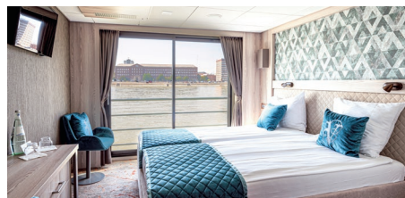
Superiorkabine auf dem Mittel- & Oberdeck